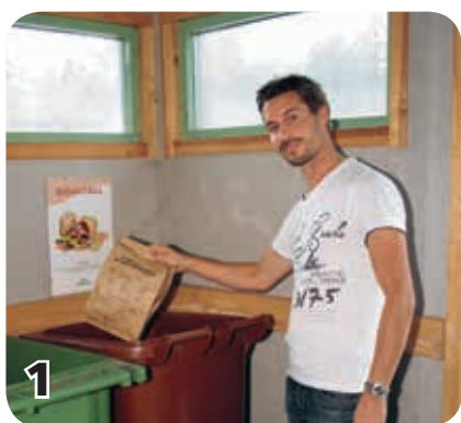
1 Lägga papperspåsen i den bruna tunnan.

När du sorterat ut ditt matavfall hämtas det av sopbilen och körs till biogasanläggningen. Där blir det biogas och biogödsel. Tack för att du sorterar!