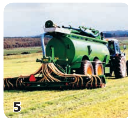
5 Gödslet används på åkrarna vid odling av mat.