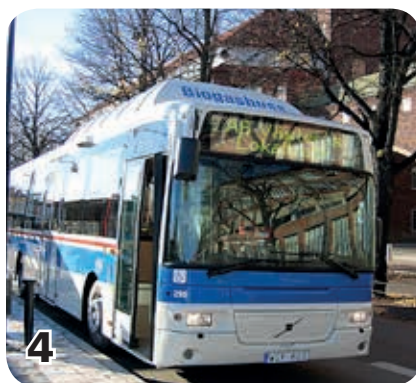
4 Biogasen används till busar, bilar och renhållningsfordon istället för bensin och diesel.