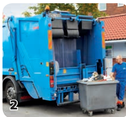
2 Tunnan töms i en sopbil. Bilen har två olika fack, ett för matavfall och ett för restavfall.