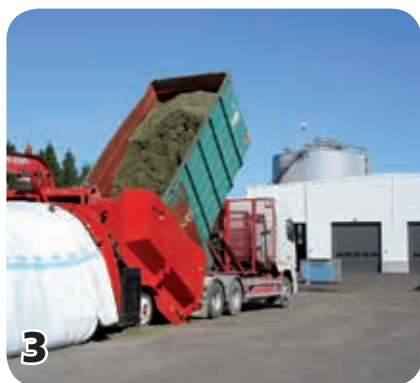
3 I Västerås blir matavfallet biogas och gödsel.